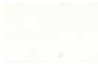
116 *** ■ Blanc de Titane Titanium White Titanweiß PW6/PW4