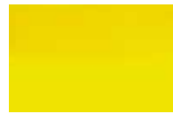
501 *** □ Jaune Citron Lemon Yellow Zitronengelb PY3